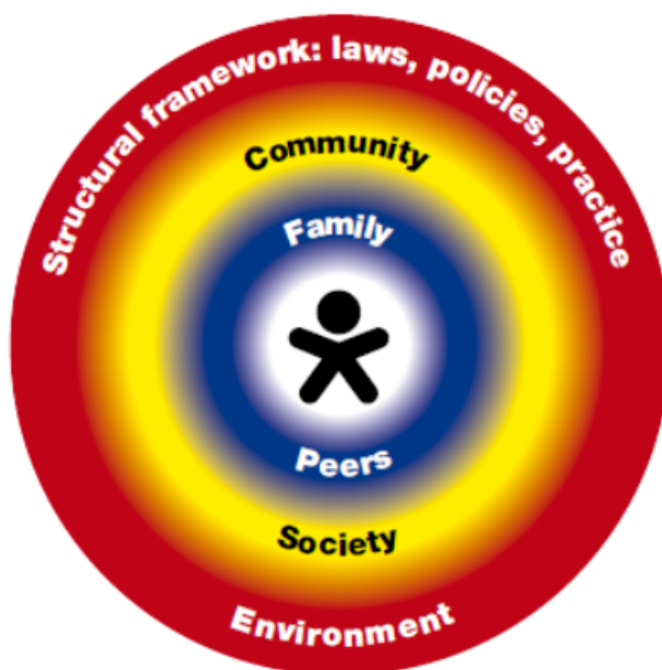
Figure 2: Risk and resilience influence the child's vulnerability and interact at different levels